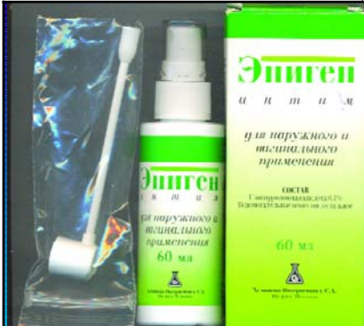
ეპიგენ ინტიმი 60მლ EPIGEN INTIM 60ML