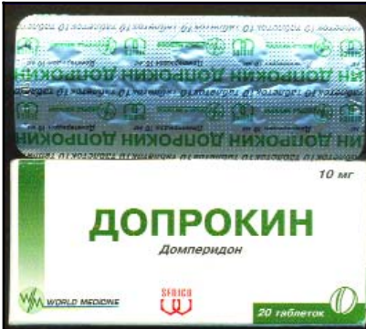
დოპროკინი 10მგ ტაბ. №20 DOPROCIN 10MG TAB. N20