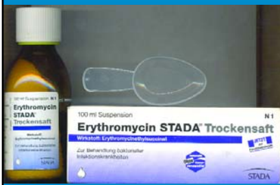
ერიტრომიცინი სტადა 100მლ სუსპ. ERYTHROMICIN STADA 100ML SUSP.