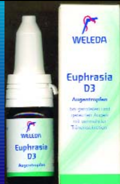
ეუფრასია ღ3 EUPHRASIA D3