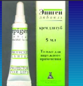
ეპიგენ ლაბიალ 5მლ კრემი EPIGEN LABIAL 5ML CREAM