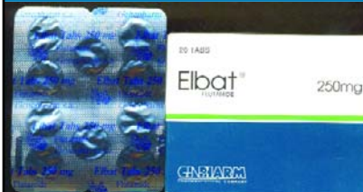
ელბატი 250მგ ტაბ. №20 ELBAT 250MG TAB. N20