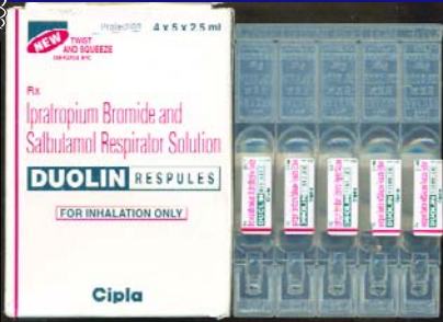
დუოლინ რესპულსი 2,5მლ DUOLIN RESPULES 2,5ML