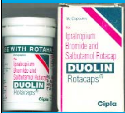
დუოლინ როტოკაპს №30 DUOLIN ROTOCAPS N30