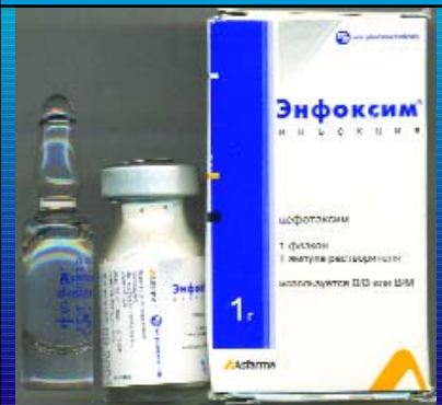
ენფოქსიმი 1გ ENFOXIM 1G