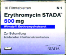
ერიტრომიცინი სტადა 500მგ ტაბ. №10 ERYTHROMICIN STADA 500MG TAB. N10